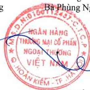
Phó Tổng Giám đốc